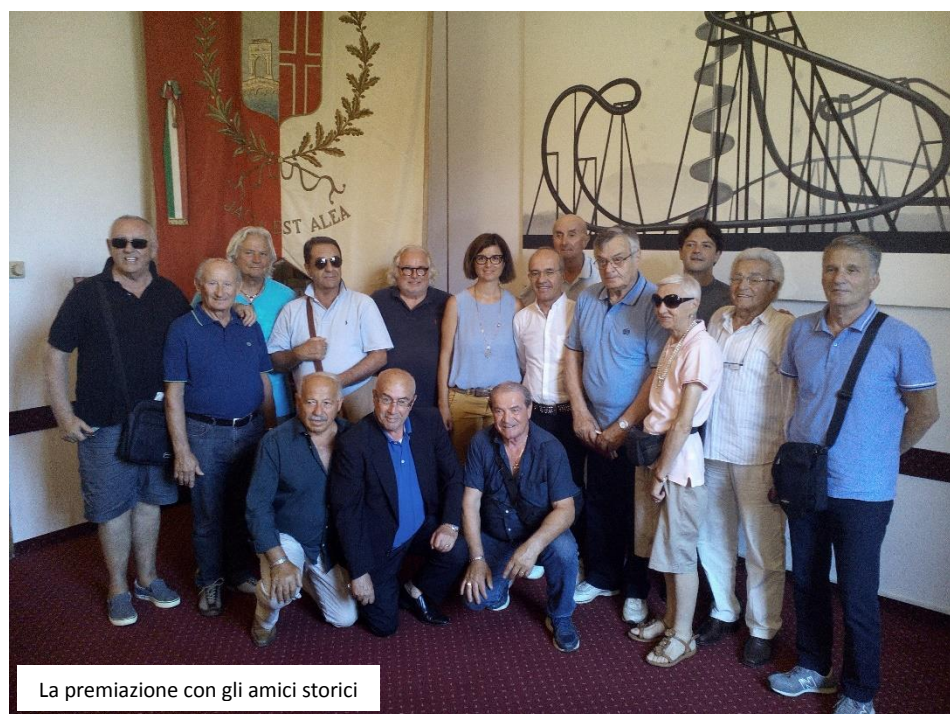
La premiazione con gli amici storici