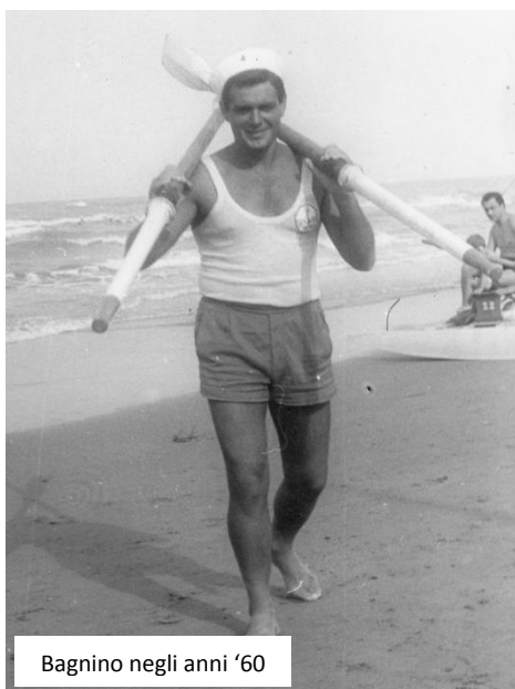
Bagnino negli anni '60

La medaglia, che riproduce il bassorilievo del segno zodiacale della Vergine presente nella cappella dei Pianeti del Tempio Malatestiano, rappresenta un riconoscimento per il lavoro svolto in oltre quattro decenni dal regista e ideatore della storica trasmissione "In zir par la Rumagna" , oggi 86enne.